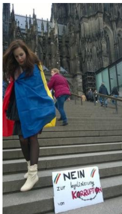
Foto: Cristina Remes/Nu Legii Gratierii si NU Dezincriminarilor - #vavedem Hotilor!

S-a iesit in strada si la Frankfurt. Romanii din Germania nu au uitat nicio clipa de tara lor, de cei lasati in urma acasa.